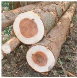
鴨川市の整備された山で育つ杉